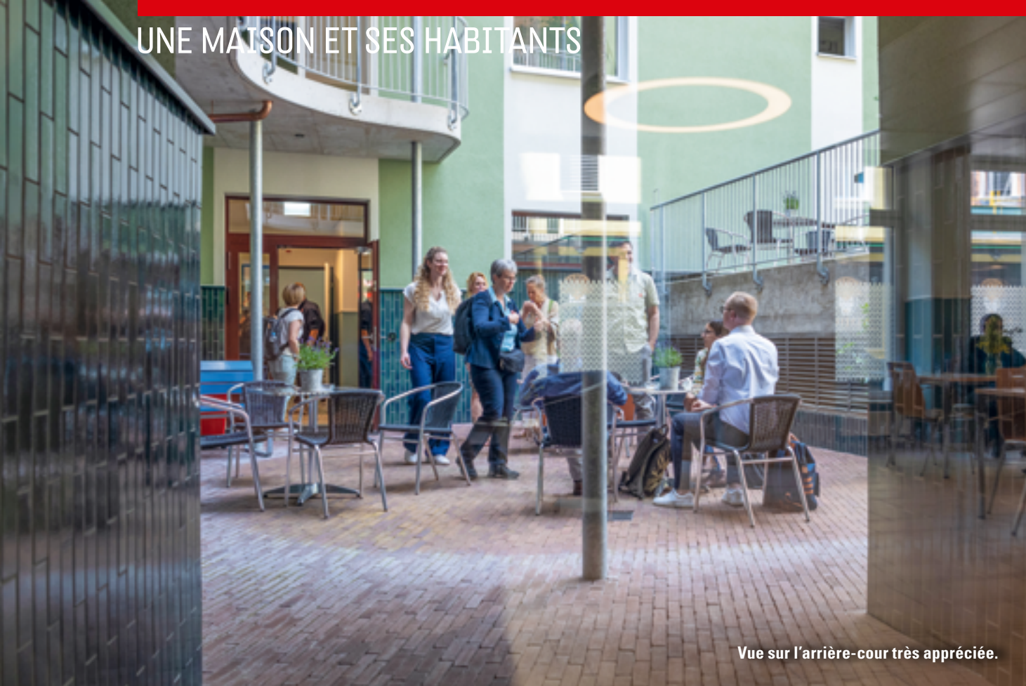
Vue sur l'arrière-cour très appréciée.