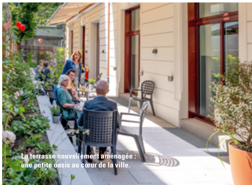
La terrasse nouvellement aménagée : une petite oasis au cœur de la ville.