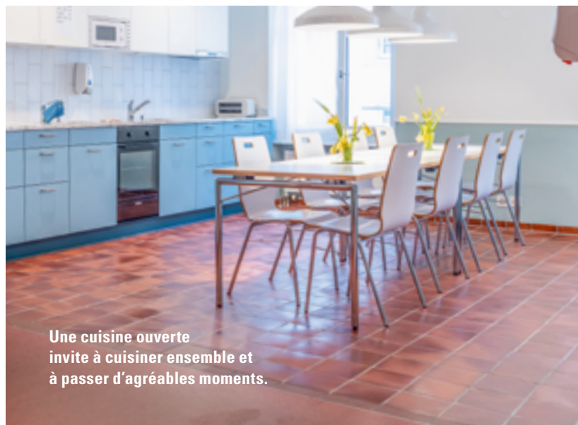
Une cuisine ouverte invite à cuisiner ensemble et à passer d'agréables moments.

Mehmet S. est l'un de ces habitants. En raison d'un trouble psychique, le jeune homme a de la peine à habiter de manière autonome. Après avoir quitté une colocation problématique