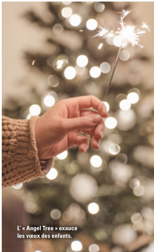
L'« Angel Tree » exauce les vœux des enfants.

Dans son travail, Renate vit parfois des moments heureux, mais aussi des moments plus tristes : « Un destin tragique auquel j'ai été confrontée est celui d'une femme qui a divorcé de